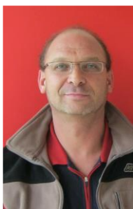
Haustechnik Armin Mader 0 83 22 / 97 99 – 55